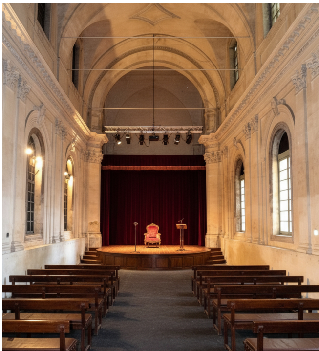
Salle de concert *