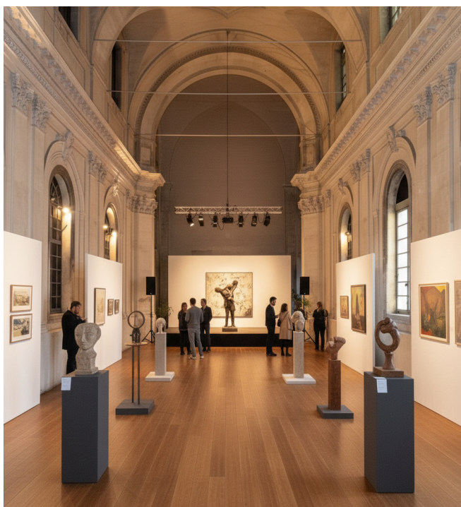
Lieu d'exposition culturelle *