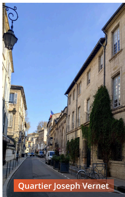
Quartier Joseph Vernet

Avignon bénéficie d'une notoriété internationale et d'une attractivité touristique exceptionnelle, renforcées par le Festival d'Avignon et un flux constant de visiteurs français et étrangers tout au long de l'année . _https://avignon-tourisme.com/.