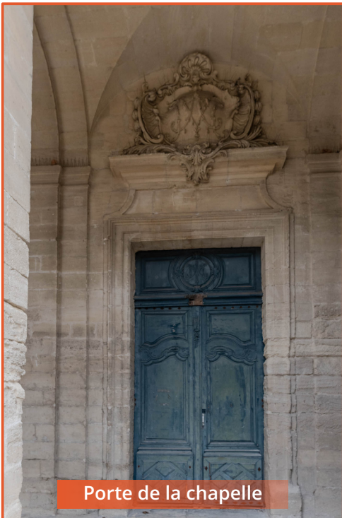
Porte de la chapelle