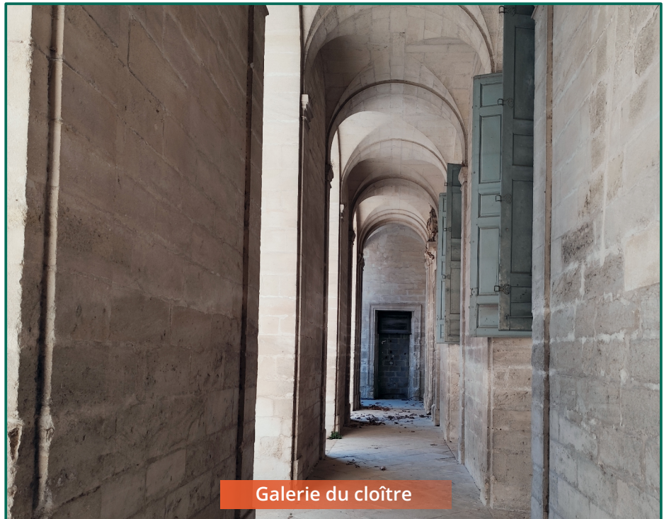
Galerie du cloître