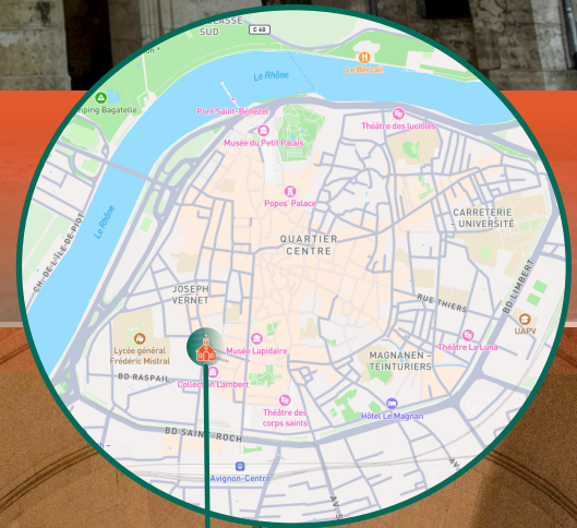
Chapelle St Charles 4, rue St Charles - Avignon

Un lieu d'exception au cœur d'Avignon une opportunité rare d'investissement