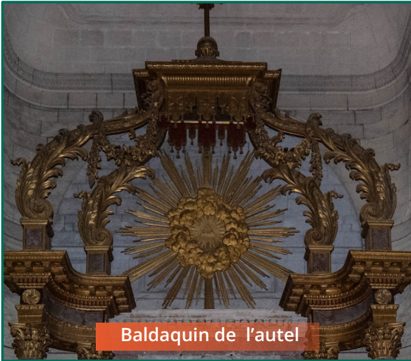
Baldaqin de l'autel