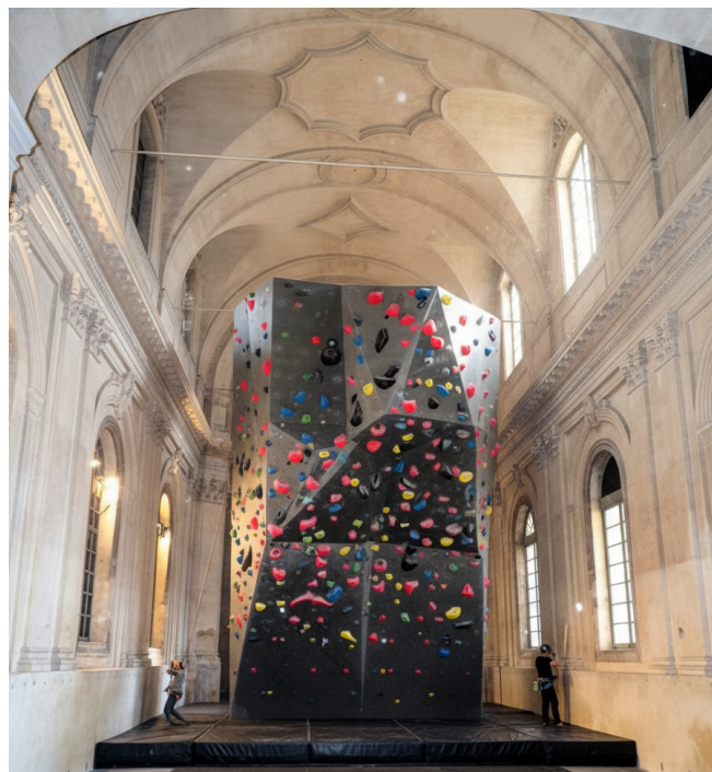
Mur d'escalade *